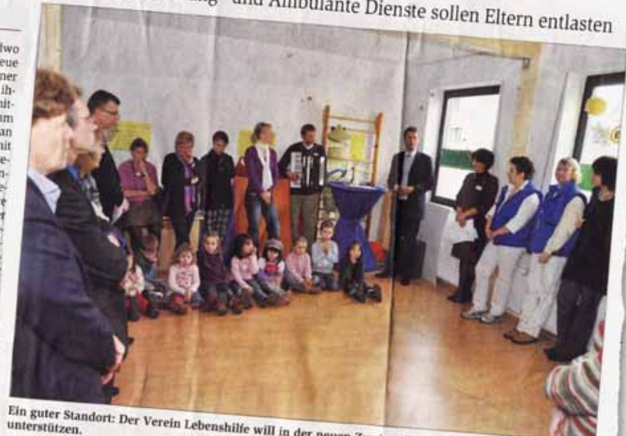
Ein guter Standort: Der Verein Lebenshilfe will in der neuen Zweigstelle Menschen mit Behinderungen unterstützen.

So verfügt die Lebenshilfe neben Werkstätten für Behinderte auch über Wohnheime wie das