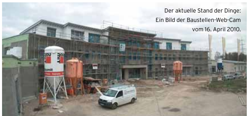
Der aktuelle Stand der Dinge: Ein Bild der Baustellen-Web-Cam vom 16. April 2010.

Vollkraft sowie drei Mitarbeiter auf 400 Euro-Basis beschäftigt sind.