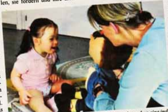
Auch und gerade Kinder mit geistiger Behinderung brauchen eine individuelle Frühförderung.